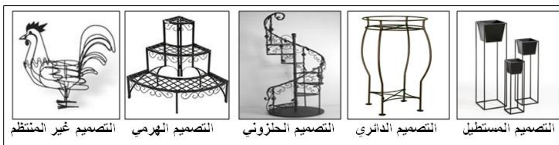
شكل (٤) يبين التصميمات العامة لحاملات الزهور المعدنية